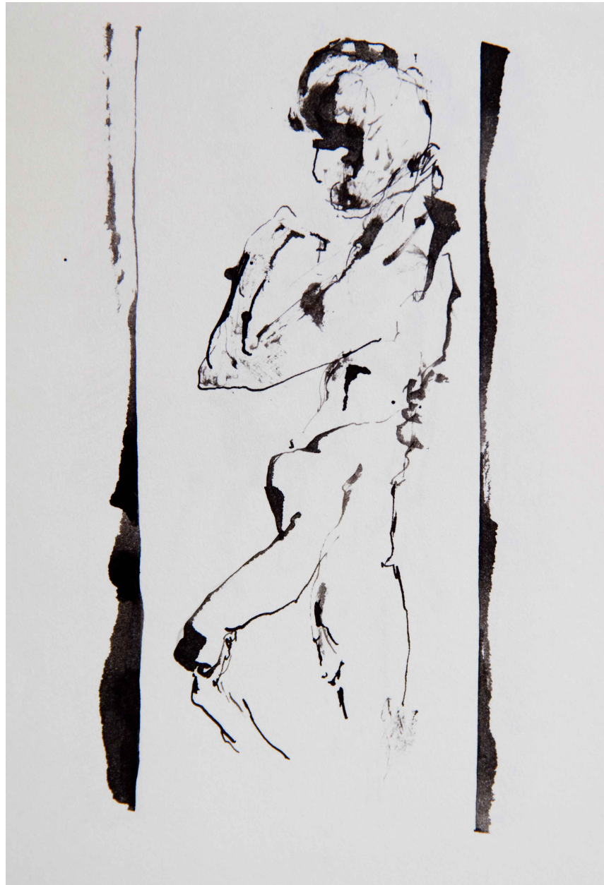
Gefühl (Feder, Tinte auf Papier) 18 x 15 cm, 2002

Skizzen mit dem Kugelschreiber oder der in Tinte eingetauchten Feder können kraftvoll sein, wenn sie die ganze Konzentration auf den kurzen Augenblick lenken, in welchem die Finger in wenigen unwiderrufflichen Strichen etwas noch nicht Ausgesprochenes formulieren.